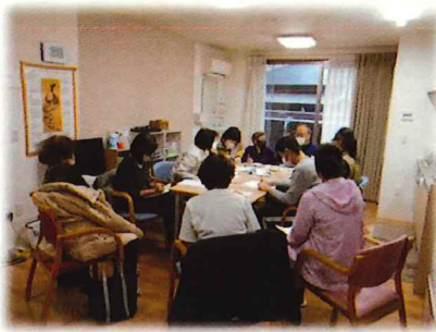
ご家族との学習会の様子