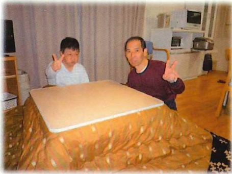
こたつでほっこり

発行日 2023年4月 発行所 社会福祉法人 大阪福祉事業財団 (障がい児入所施設) 豊里学園 (障がい者支援施設) あさひ希望の里 (乳児院) すみれ乳児院 発行責任者 旭ブロック長 豊里学園 園長 山中ひろみ 大阪府旭区太子橋1-16-24 TEL: (06) 6951-2066 FAX: (06) 6951-2541 豊里学園 URL http://toyosatogakuen.com あさひ希望の里 URL http://asahikibunnosato.com すみれ乳児院 URL http://sumirenyuujiij.com